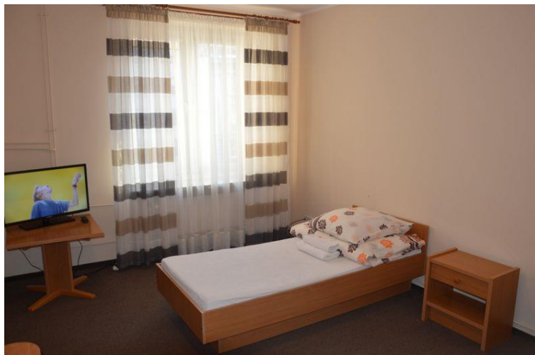
Rysunek 3 Zdjęcie przedstawiające pokój w hotelu

W Centrum są jedno- i kilkuosobowe pokoje wyposażone w wygodne łóżka.