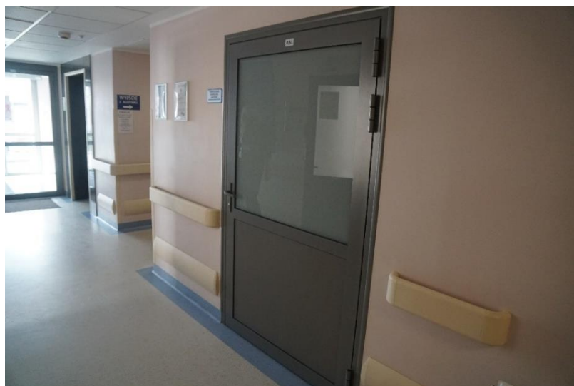
Rysunek 13 Zdjęcie przedstawiające pomieszczenie w Izbie Przyjęć, gdzie można wypożyczyć wózek

W Izbie Przyjęć, znajdującej się za portiernią, możesz wypożyczyć wózek inwalidzki.